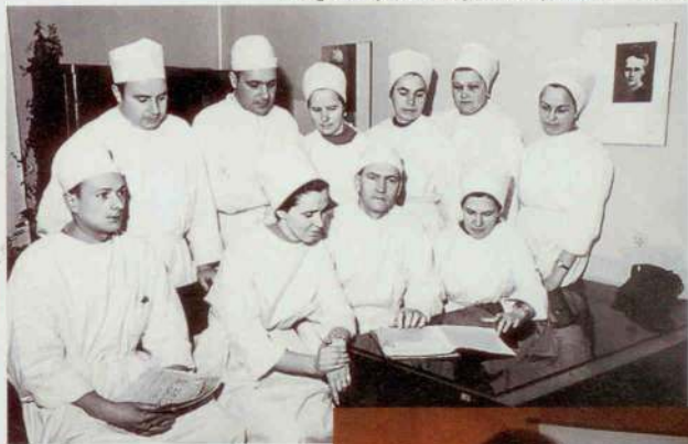
Būšu matemātiķe vai ķirurgē – tāds ir jautājums.